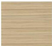
rovere sbiancato blached oak