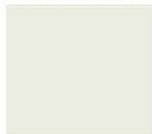
laccato bianco white lacquered