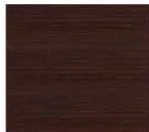
rovere noce scuro oak dark walnut