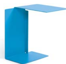
DIANA B 2002