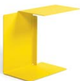
DIANA A 2002