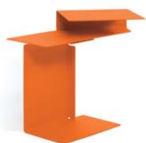
DIANA E 2002