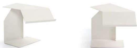
Cremeweiß / creme white

Mesa auxiliar de chapa de acero, microestructura de laca pulverizada. Parte superior girable. Parte inferior recubierta de polietileno. Detalles y colores ver lista de precios.